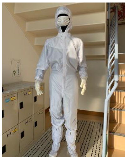
① 同社の扱うクリーンウェア