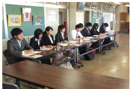
H25.5.17 塩山南小学校での開講式から

初任者の研修に対する積極的な姿勢を拝見し、今後の研修会を通じての成長が楽しみになりました。実習校の先生方、初任者のためによりしくお願いします。また、所属校におかれましても、ご指導よりお願いします。