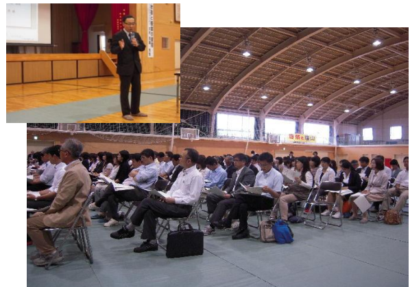
H25.5.29 塩山中学学習会 河村茂雄教授(早稲田大学)