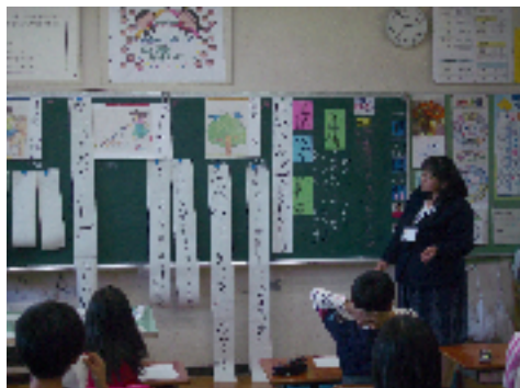
10/24 牧丘第一小 山元和香子教諭（3年国語）

10月に入り各学校の行事が一段落し、いよいよ研究授業を中心とした校内研究が展開されています。それぞれ研究テーマに沿った授業が行われていますが、授業風景を簡単に紹介します（全部の学校を紹介できませんが）。