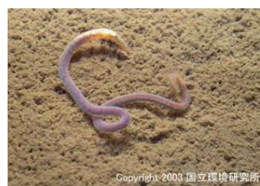
NO. 28 エラミミズ