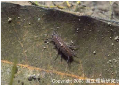
NO. 19 ミズムシ