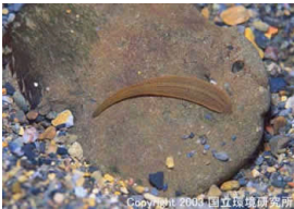
NO. 22 ヒル