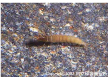
NO.10 コガタシマトヒゲケラ