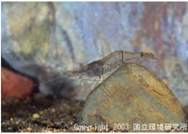
NO. 16 スジエビ