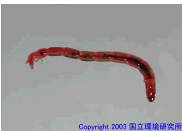
NO. 26 セシジユスリカ