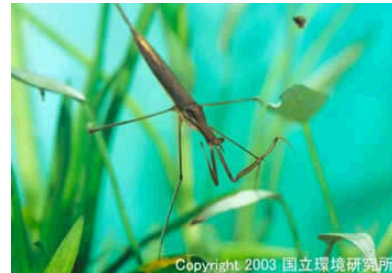
NO. 20 ミズカマキリ