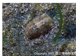
NO. 24 イソコブムシ