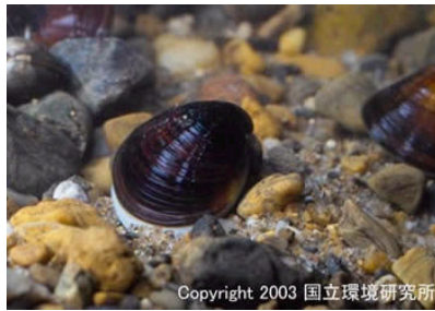
NO. 17 ヤマトシジミ