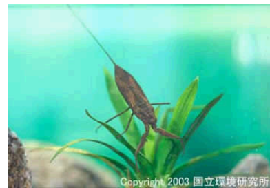
NO. 21 タイロウチ