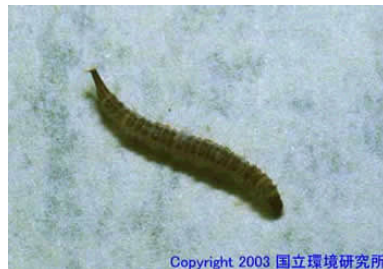
NO. 27 チョウハエ