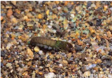
NO.11 オシマトヒゲケラ