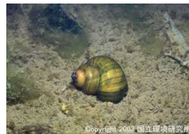
NO. 23 タニシ