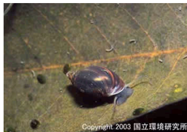
NO. 29 サカキガイ