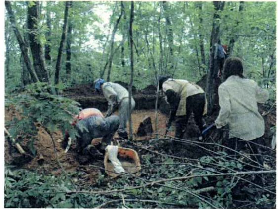
(浅尾原遺跡の発掘調査)

○ (財) 山梨県環境整備事業団では、 埋蔵文化財発掘のため、 平成18年5月19日より立木伐採を開始し、 順次、北杜市教育委員会による 遺跡調査を行っています。