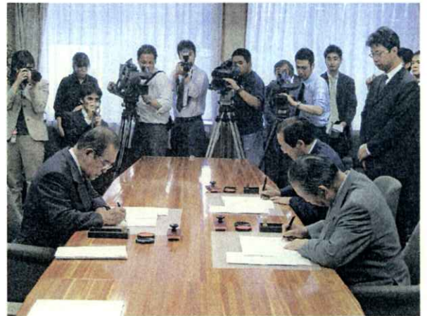
（平成18年6月8日 県庁第1応接室）