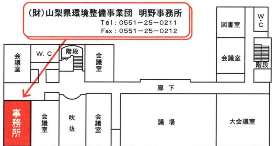
北杜市明野総合支所 2階平面図