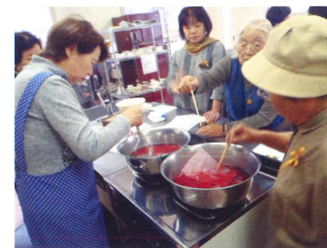
ピオラ染め体験の様子

当日は県内外の方20名が参加して、『御師の家「毘沙門屋」でのお礼づくり』や、『ピオラ染め&フレッシュハーブティーパーティー』を行い、『ミニマルシェ』では富士北麓の特産野菜などの買い物も楽しんでもらいました。昼食は、御師の家「中雁丸」で、郷土料理の吉田のうど