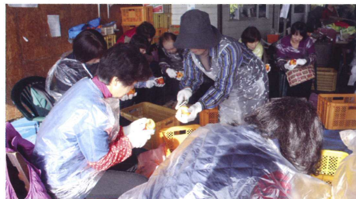
秋の風物詩「枯露柿作り」体験

グループでは、参加者の意見やツアーの反省点などを参考に、地域資源を生かした活動の発展を目指しており、普及センターでも引き続き支援を行っていきます。