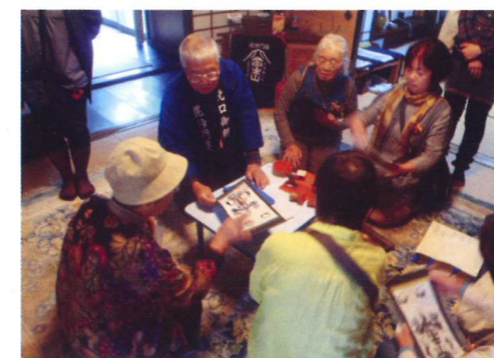
御札づくり体験の様子

参加者からは、「ピオラ染めが楽しかった」「都会では体験できない企画で、とても良かった」などの意見をいただきました。今後も、農村資源の魅力を活かして、交流人口の増加に向けた支援を行っていきます。