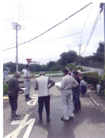
現地での講習会の様子

こうした活動により、生産者個々の環境に配慮した農業に対する意識が高まるとともに、消費者に安全、安心を届けるため、化学肥料・化学合成農薬を50%以上削減した特別栽培米「梨北信玄米」の栽培に積極的に取り組んでいます。