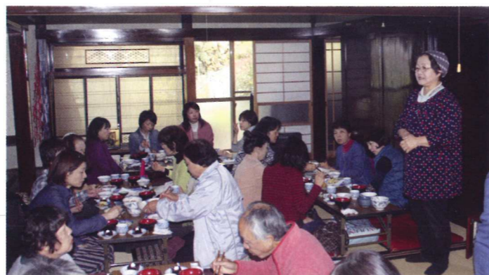
縁側カフェやまいちでの昼食