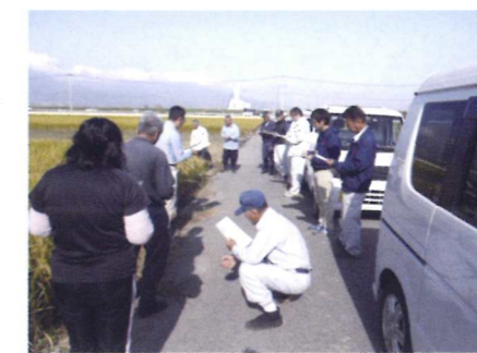
取り組み検討会議（2月）

普及センターでも、来年の生産に備え「スイートコーン後作ほ場での肥培管理」、「省力化のための基肥一発肥料の活用」、「養鶏業者の鶏ふん堆肥の利用」等について、調査結果をもとに、農家と意見交換をしながら栽培方法の改善を図る予定です。