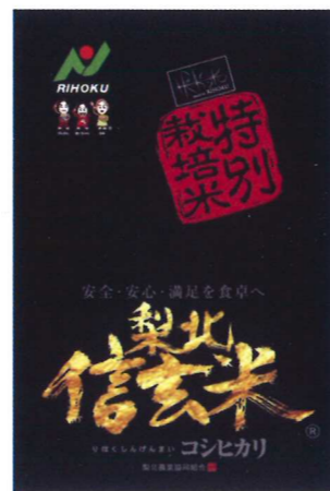
「梨北信玄米」パッケージ