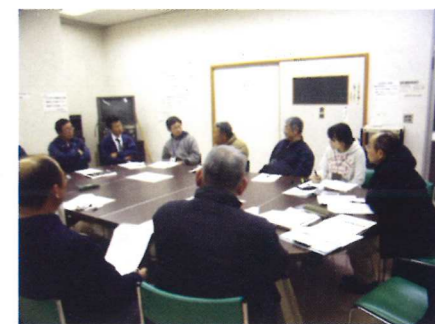
収穫適期判定の現地検討会（10月）