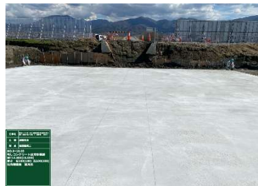
底版コンクリート打設状況