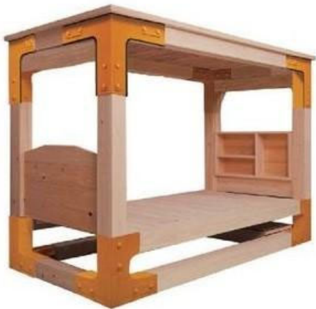
シングルサイズ用