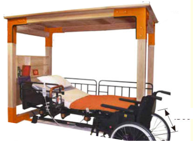
介護ベッド用シェルター