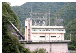
奈良田第一発電所