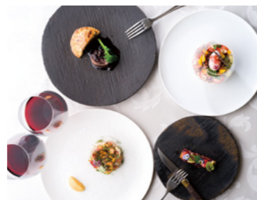
県産食材を使った創作メニュー