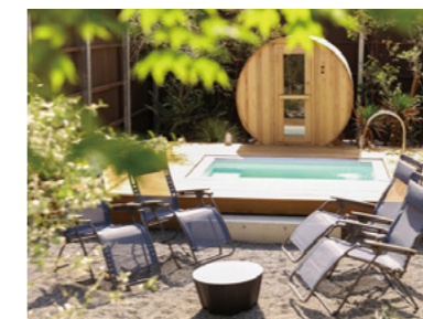
森の中のバレルサウナ (MATKA)

国への要望活動や特設サイトを通じた情報発信により、アウトドアサウナを活用した地域活性化に取り組んでいきます。