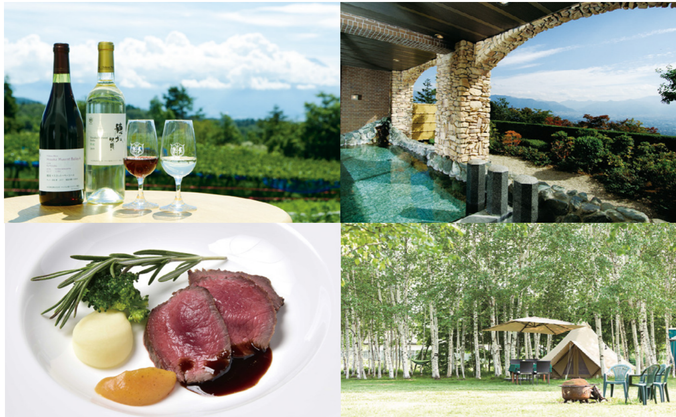
ワイン、食、温泉、グランピングなど、山梨ならではの観光コンテンツが充実

山梨県は、豊かな自然環境、先人たちが積み重ねてきた歴史や文化、四季の特徴が際立つ気候、風土の恵みである食といった、観光地として必要な要素を高いレベルで兼ね備えています。本県が魅力的な地として観光客から選ばれ満足してもらえるよう、これらの地域資源を活用するとともに、これまで観光に活用されてこなかった新たな地域資源を掘り起こし、磨きをかけ、光を当てる取り組みを進めています。また、観光客が訪れることで、地域社会が活性化し、観光事業者にとっても働く魅力が向上するよう、観光産業の高付加価値化を推進しています。