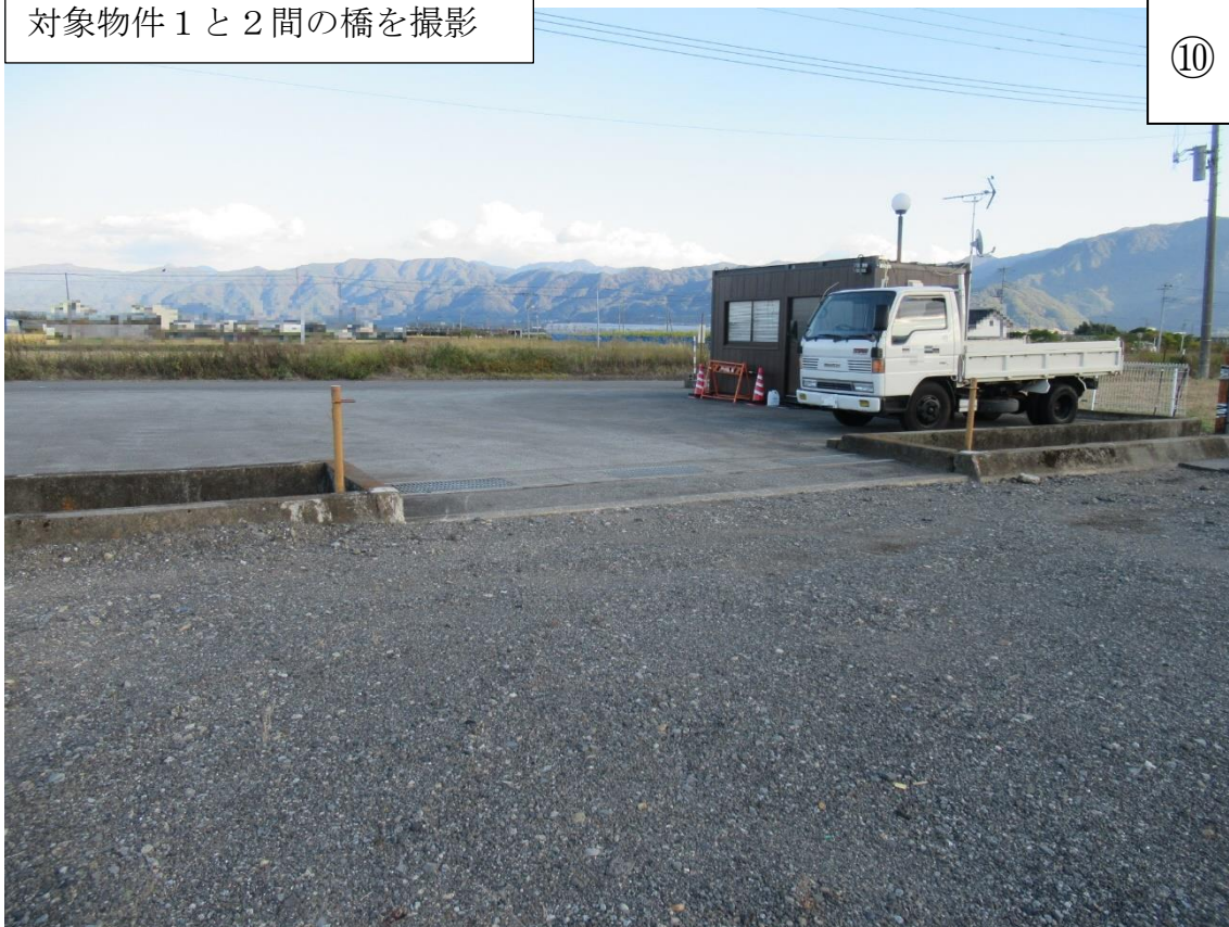
対象物件1・2の間の水路