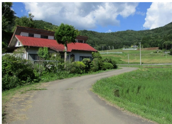
② ため池下流には人家があり、大規模地震の際には甚大な被害のおそれがあるため、早急に対策を講じる必要がある。