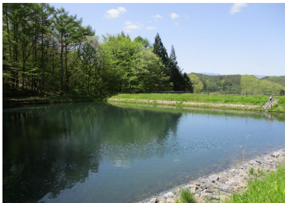
① 浅川ため池 全景 貯水量 14,000m 3 、堤高 H=5.1m