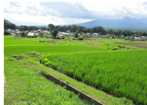
③ ため池下流の受益農地の状況