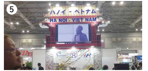
①うどんに良く似たゲアン名物チャオカイン ②ナレーション録音で訪れたテレビ局 ③マンションが並ぶヴィン市の中心部 ④同僚たちとパンフの確認中 ⑤日本での観光イベントで流されたPR動画