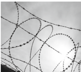
Perimeter Concertina Wire

Due to his father's job with the US Navy, he spent his childhood in Hawaii, Alaska, Washington State, Yokosuka, and Yokohama. While in high school, he came to Japan as an exchange student for one year, returned to Washington State, and graduated from high school. Upon graduation, he entered the US Air Force and was assigned to bases in Florida and the former West Germany. He was honorably discharged from the US Air Force, entered the US Air Force Reserves, graduated from Washington State University, and came to Yamanashi as a Coordinator for International Relations. He eventually went on to complete graduate school at Troy State University and worked in the Japanese auto industry in Japan and eventually the Boeing Company (USA). In 1999, he began working for the Department of Defense civilian at Camp Zama Japan, followed by postings in Germany and Michigan (USA). In 2012 he went to Afghanistan and now resides in Michigan (USA) with his wife and son.