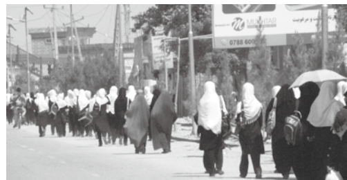
学校から帰宅する少女たち

CIR時代と変わらず、穏やかにインタビューに答えてくれたスコットさん。アフガンから帰国し、平和の尊さを改めて感じたと話してくれました。