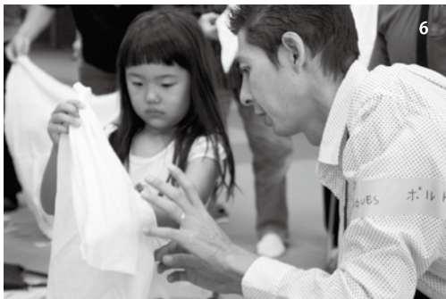
1、2、3 キーパーソンによる避難所宿泊体験 4 災害時通訳ボランティアセミナー 5 多文化共生マネージャー全国協議会理事 高橋伸行氏 6 避難所体験 救急法指導

8月24日(土)～25日(日)、甲府市、新田地区自治会連合会の皆さんと共に、ブラジル、中国、タイ、ペルー等出身のキーパーソン10名が参加し、「避難所宿泊体験」を行いました。