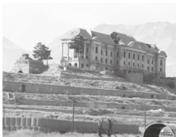
King's Palace where strewn with land mines