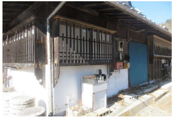
浴室・台所の出窓格子