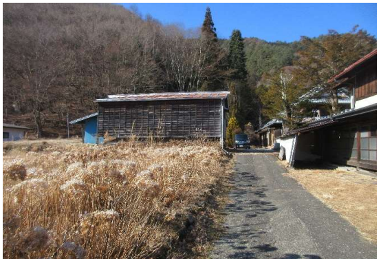
東側道路からの進入路