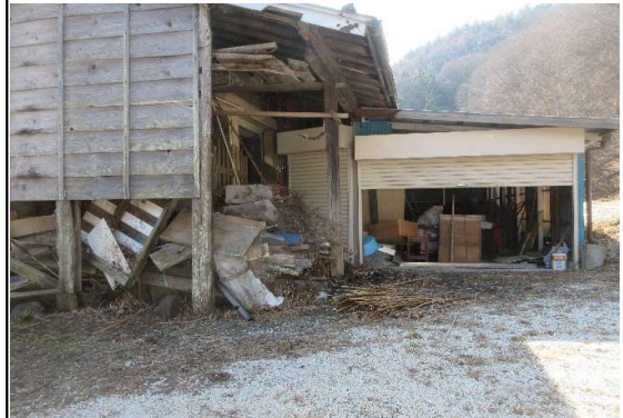
土蔵に差し掛け車庫