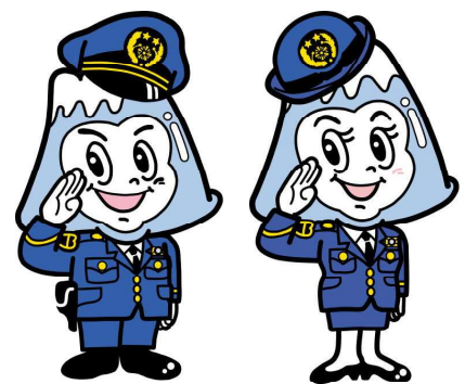
山梨県警察シンボルマスコット