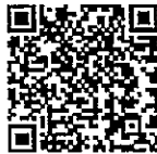
「やまなし子育てネット」QRコード

平成30年4月より、県内全域での病児保育の広域利用が始まりました。病児保育施設を持たない市町村の住民も、自由に利用することができます。また、利用登録や施設の「空き状況」の確認を「やまなし子育てネット」で行うことができます。(右のQRコードからご確認いただけます。) 利用料金、開所時間などは直接施設にお問い合わせください。 なお、病状によっては利用できないこともあります。