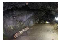
⑪船津胎内樹型 ※⑫吉田胎内樹型の内部は一般公開されていません

1768年に建てられた御師の家。御師は、富士登拝に訪れる富士講を迎え入れ、食事や宿泊の世話をするとともに布教活動も行い、富士山信仰を支えていました。