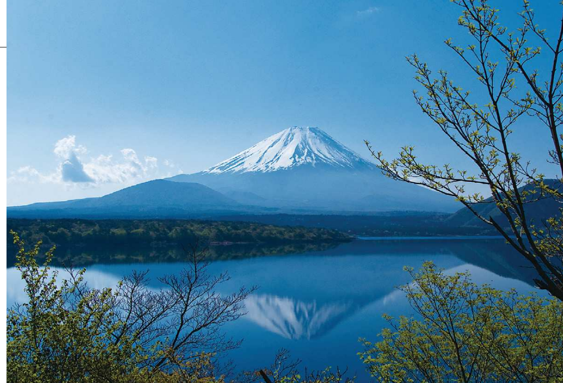
中ノ倉峠から望む富士山と本栖湖

このような富士山の歴史や文化にゆかりのある25の構成資産には、その山体だけでなく、周囲にある神社や風穴、溶岩樹型、湖沼などもあります。ユネスコ世界遺産委員会はこれらの価値を認め、未来に受け継ぐべき世界の宝として世界文化遺産への登録を決定したのです。