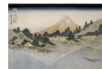
富士三十六景 甲州三坂水面 (葛飾北斎) 山梨県立博物館蔵

つえを使って登る者、疲れて腰を下ろす者、岩室で休む者など富士山頂付近の富士講が描かれています。信仰の山としての富士山を主題にしていることが感じ取れます。