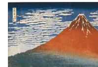
富士三十六景 凱風快晴 (葛飾北斎) 山梨県立博物館蔵

通称「赤富士」。凱風とは南風のこと、夏の朝、赤みを帯びた富士の山肌が目を受け、さらに赤く輝く現象が起こります。その一瞬を簡潔な構図と色彩で伸びやかに描いています。