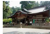
⑩北口本宮富士浅間神社

富士山信仰の聖地。富士講が富士登拝に出発すると、まずこの神社を参拝し、境内にある登山鳥居をくぐり富士山頂を目指しました。