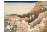
富士三十六景 諸人登山 (葛飾北斎)

通称「赤富士」。凱風とは南風のこと、夏の朝、赤みを帯びた富士の山肌が目を受け、さらに赤く輝く現象が起こります。その一瞬を簡潔な構図と色彩で伸びやかに描いています。