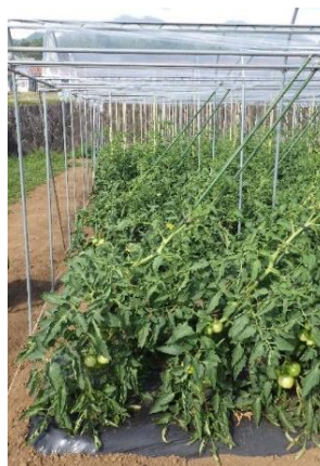
図2 斜め誘引したトマト栽培の様子