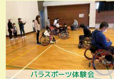
パラスポーツ体験会