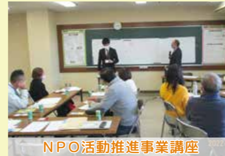
NPO活動推進事業講座

ボランティア・NPO活動は、どなたでも気軽にできる社会貢献活動です。 ボランティア・NPO活動の大切さが改めて見直される今、 みなさんも、自分に合った活動を見つけ、参加してみませんか。