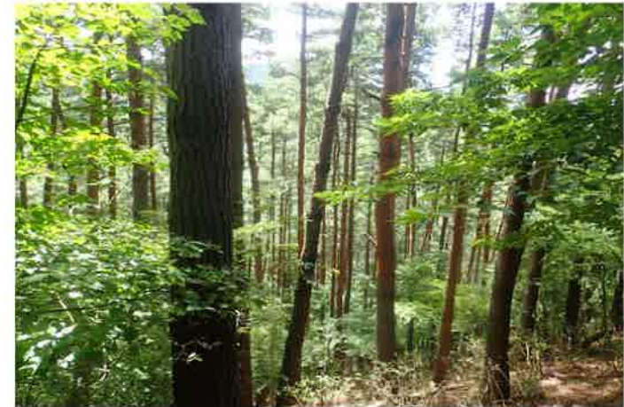
主伐予定箇所 146林班に1小班