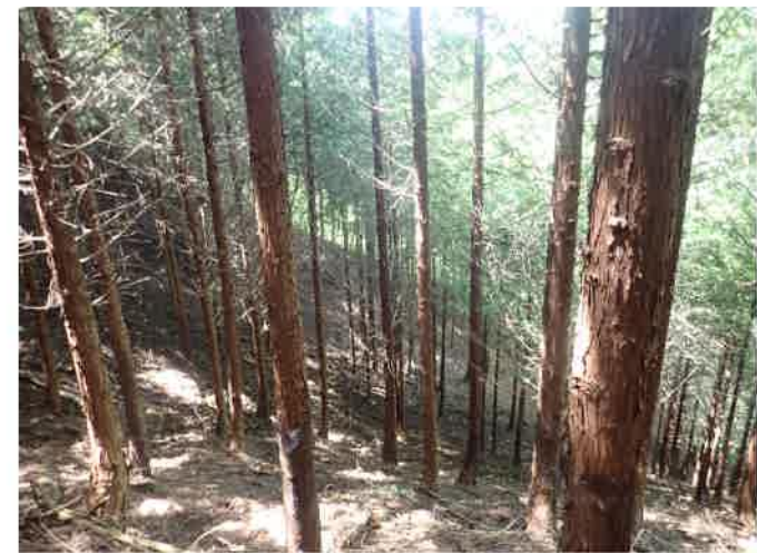
収穫間伐予定箇所 146林班ほ13小班