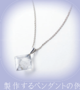
製作するペンダントの例

申込先・体験場所：山梨ジュエリーミュージアム TEL:055-223-1570 〒400-0031 甲府市丸の内1-6-1 山梨県防災新館1Fやまなしプラザ内