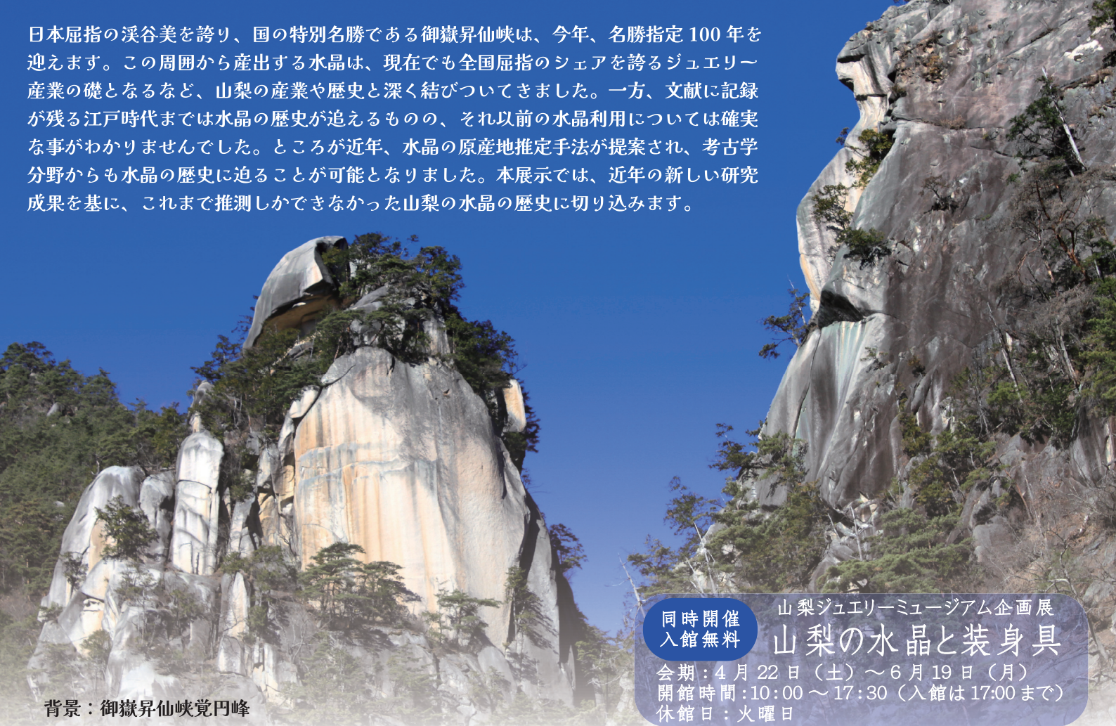
背景：御嶽昇仙峡覚円峰

日本屈指の溪谷美を誇り、国の特別名勝である御嶽昇仙峡は、今年、名勝指定100年を迎えます。この周囲から産出する水晶は、現在でも全国屈指のシェアを誇るジュエリー産業の礎となるなど、山梨の産業や歴史と深く結びついてきました。一方、文献に記録が残る江戸時代までは水晶の歴史が追えるものの、それ以前の水晶利用については確実な事がわかりませんでした。ところが近年、水晶の原産地推定手法が提案され、考古学分野からも水晶の歴史に迫ることが可能となりました。本展示では、近年の新しい研究成果を基に、これまで推測しかできなかった山梨の水晶の歴史に切り込みます。