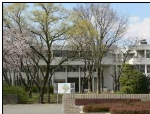
【山梨県総合教育センター】