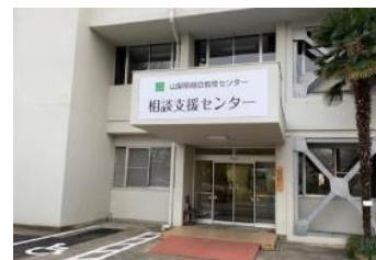
【相談支援センター】