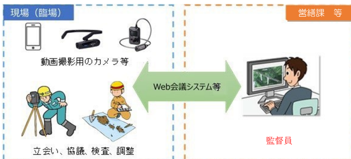
図 3-1 機器構成（例）

なお、Web 会議システム等については、公共工事、公共発注機関等で活用実績があるなど、十分な情報セキュリティが確保されたものとする。