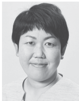
いわぶち 友 1976年生まれ。 参議院議員1期、 党中央委員