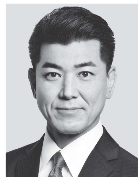
立憲民主党 代表 泉 健太