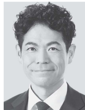
たけだ 良介 1979年生まれ。 参議院議員1期、 党中央委員