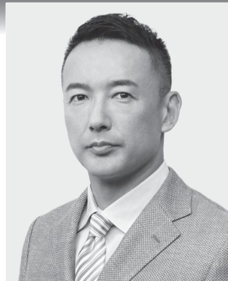
れいわ新選組 代表