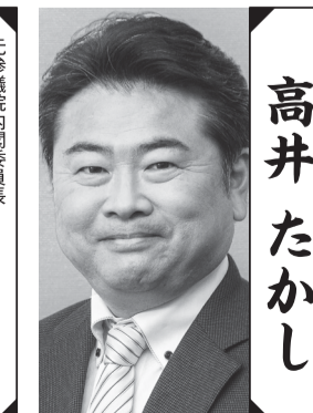
前参議院議員/れいわ新選組幹事長 高井 たかし