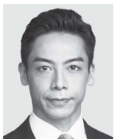
くりした ぜんこう くりした善行