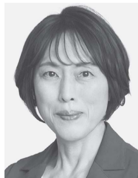
田村 智子 1965年生まれ。 党副委員長・ 政策委員長、 参議院議員2期