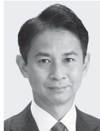
谷あい 正明 現3 元農林水産副大臣、党参議院幹事長。京都大学大学院修士課程修了。49歳。