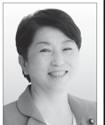
社民党党首 福島みずほ