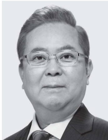
よこやま 信一 現2 前復興副大臣。北海道大学大学院博士課程単位取得。水産学博士。62歳。

公明党はこの7人をはじめ参院選比例区に17人を公認しています。 ※年齢は選挙期日現在