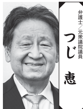
弁護士/元参議院議員 つじ 憲