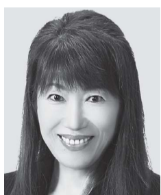
はたとともこ はたとともこ