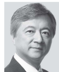
はく しんくん 白しんくん