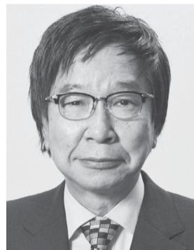
大門 みきし 1956年生まれ。 参議院議員4期、 党中央委員