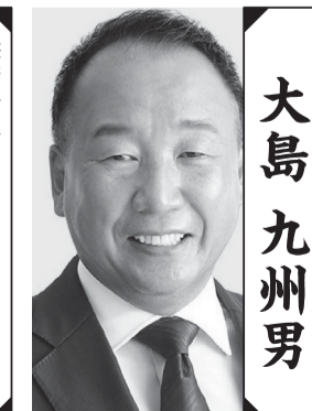
元参議院内閣委員長 大島 九州男