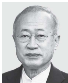
ありた よしふ 有田芳生