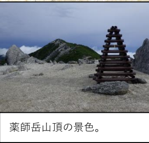
薬師ヶ岳山頂の景色。