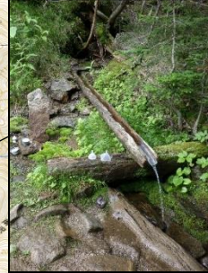
南御室小屋の水場。無料で利用できる。