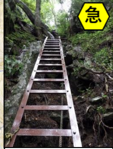
2連続・4連続のハシゴが続くので、転落に注意が必要。