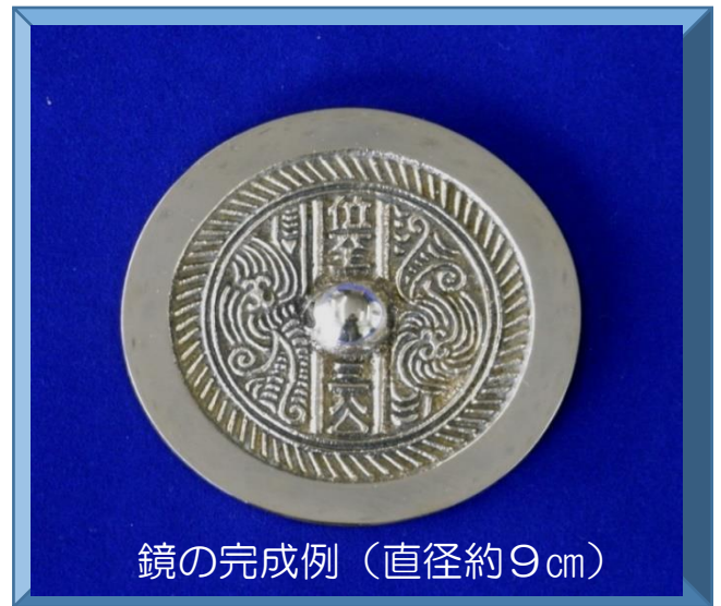
鏡の完成例 (直径約9cm)

中国の後漢時代に作られ、日本の弥生時代の人々の手を渡りながら、小さな破片になっても、愛されつづけた青銅鏡の魅力を、自分のものにしませんか？