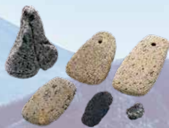
長泉町桜畑上遺跡 軽石製品 (静岡県埋蔵文化財センター蔵)

今回、山梨県側の会場となる当館では、日本最古級のムラから見つかった石器を始め、国内でも数点しか見つかっていない旧石器時代の石製品、山梨・長野の影響を受けた縄文土器など、静岡県の旧石器時代・縄文時代の魅力を伝える文化財を幅広く紹介しています。約3万8千年前、日本列島に人類がやってきたときから続いている「山の洲」のつながりをのぞいてみてください。