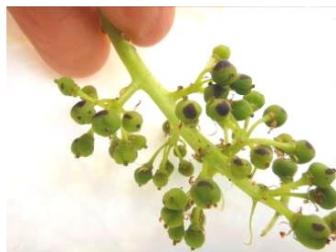
図3 果粒に生じたこすれ傷 (第1回目ジベレリン処理後)