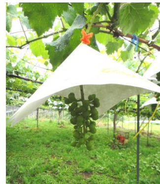
図1 専用タイベックカサ装着状況

圃場接種試験により評価した。値は発病度の平均値 供試房数:1品種あたり4~5果房 最終調査日:8/22 以下の指数により発病状況を調査し、発病度を算出した。 発病指数 0;なし、1;1房あたり5%以下の果粒が発病、3;6~20%、 5;21~50%、7;51%以上 発病度 = \sum(指数 \times 程度別発病房数) \times 100 \div (7 \times 調査房数) z 6/12接種 ピオーネ縦4.4mm 横5.0mm、シャインマスカット 落花～マッチの頭大 赤嶺 落花～マッチの頭大 y 6/29接種