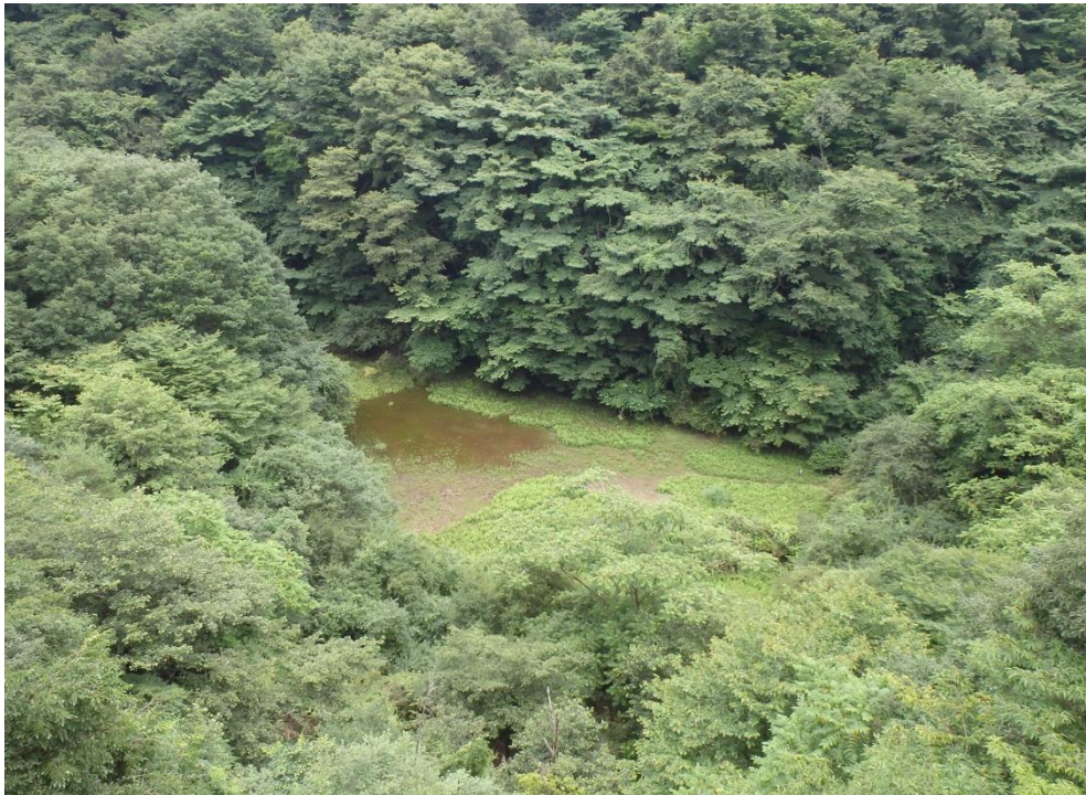
図1 富士山麓で9年ぶりに出現した赤池（2020年7月18日撮影）